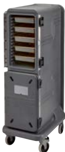
PCU1000 可容纳10个10 cm 深的GN食品盘