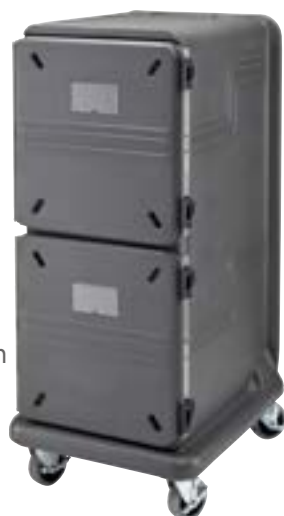
PCU2000 可容纳20个10 cm 深的GN食品盘