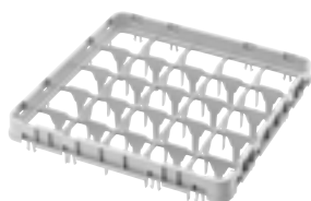
E1=标准全落下扩展架