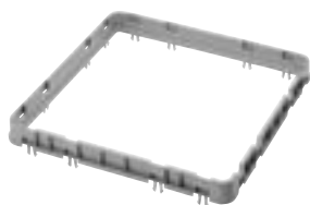
E3=标准开放式扩展架