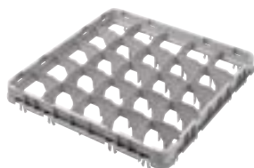
E4=标准全落下高脚杯扩展架