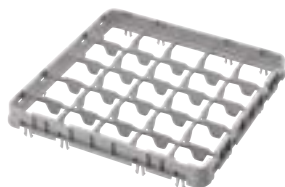
E5=标准半落下高脚杯扩展架