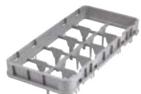
HE1=半号全落下扩展架