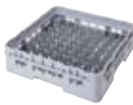
9x9 竖盘架带一个扩展架