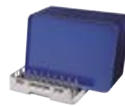
末端开放式托盘架