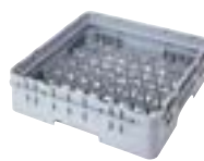
5x9竖盘架带一个扩展架