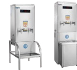
ZK-6H A: 394 B: 262 C: 776 D: 283