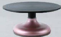
SN4168 蛋糕转台(硬膜)-玫瑰金色