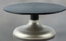
SN4167 蛋糕转台(硬膜)-金色