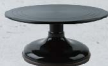
SN4169 蛋糕转台(硬膜)-经典黑色