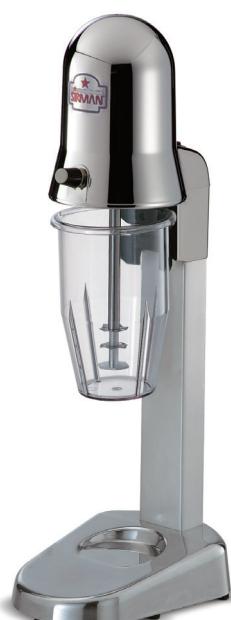
SIRIO 1 VV