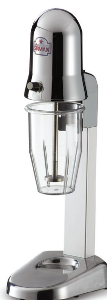
SIRIO COFFEE VV