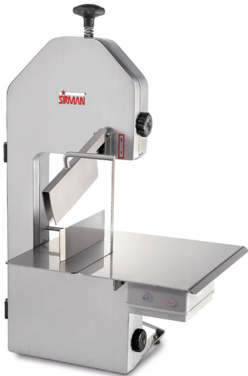
SO 1550 F3