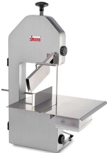
SO 1650 F3

该机为现代流线型设计，使用安全简便。用阳极氧化铝制成，明亮光洁，卫生防锈。非常简单准确，无论是调节高度还是调节横向距离都准确无误。