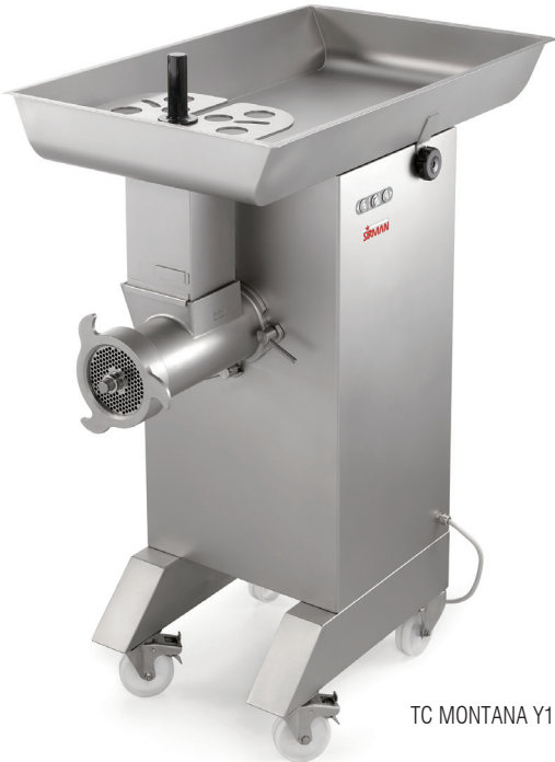
TC MONTANA Y12

大功率，高产出 马达功率达3675 W (5 HP), 产量高达 1000 kg/h, 适合于机场配餐中心、高铁配餐中心、食品加工厂等; 结实耐用 厚实的不锈钢机身, 高负载的绞肉部件, 在保证产出的同时也保证了出肉的品质; 操作简单 IP67保护级不锈钢控制开关, 无需任何工具即可将所有部件快速拆卸, 便于清洁。