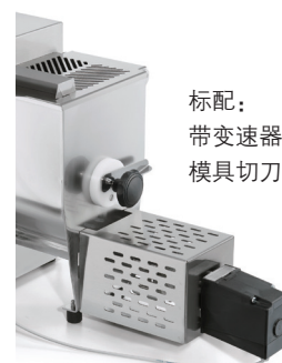
标配： 带变速器的 模具切刀