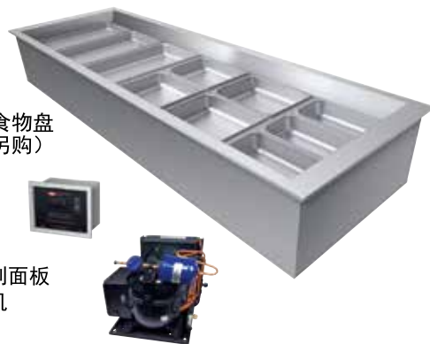
温度控制面板 和压缩机