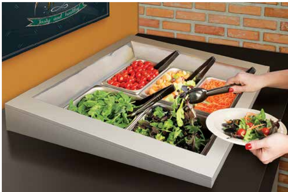
CWB-2 搭配 CWB-2SLANT 斜面选配和附带食物盘 组合效果