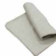
面团发酵布 棉麻 SN0462 600x1500mm