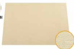
硅胶蒸笼垫 硅胶(SILICONE) SN0495 570x370mm