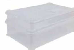
透明周转箱 聚丙烯(PP) SN4653 盖 655x425x30mm SN4654 本体(大) 640x415x160mm SN4655 本体(小) 640x415x90mm

刻度设计 独特卡口 尺寸合适 堆叠无间隙 方便观察 上下堆叠 可置于冷藏 密封性更好, 发酵情况 更加稳固 发酵箱内 面团不易干燥