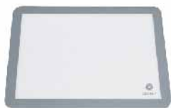
硅胶不沾布-白色 硅胶(SILICONE) SN0491 570x370mm