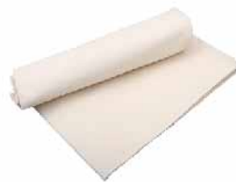
面团发酵布 棉 SN0460 600x1500mm SN0461 750x1200mm