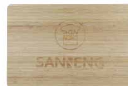
竹质发酵板 竹 SN8061 600x400x8mm

圆角设计 食品安全 功能多样 边角圆滑 天然竹木 揉面发酵 不易损坏 无漆无蜡 砧板陈列