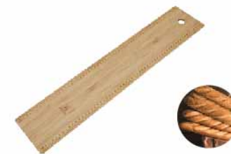
法国面包移动板 竹 SN4676 600x120x6mm