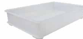
发酵箱-本体(中) 聚丙烯(PP) SN4658 580x380x110mm

圆角设计 食品安全 功能多样 边角圆滑 天然竹木 揉面发酵 不易损坏 无漆无蜡 砧板陈列