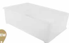
发酵箱-本体(大) 聚丙烯(pp) SN4659 580x380x150mm