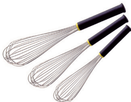
SÉRIE DE 3 FOUETS