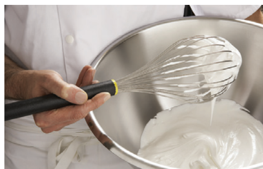
FOUET À BLANCS FMC Pomme large, fils souples.