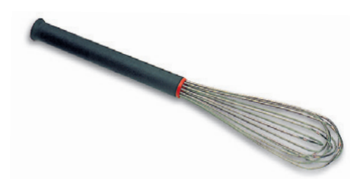
FOUET À FILS RIGIDES FMC Spécial pour mayonnaises et autres crèmes fermes.