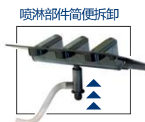
喷淋部件简便拆卸