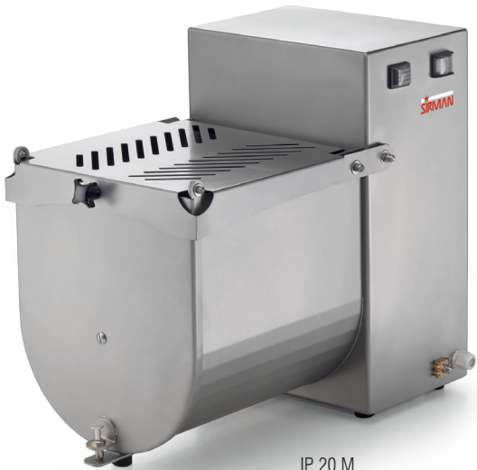
IP 20 M

双向控制 正、反两种搅拌方向控制，加工产品更加精准； 用途多样 高质量独特设计，可以混合搅拌肉馅、土豆沙拉、三明治馅料以及凉拌菜等。 Dual control Forward and reverse allow more control over the most delicate products; Multi-purpose Exclusive design to allow fast yet delicate mixing of a variety of products from sausage meat to potato salad, coleslaw and sandwich fillings;