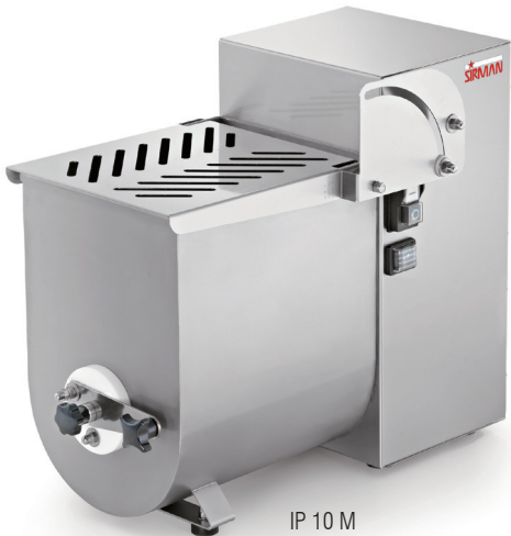
IP 10 M