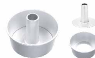
活动圆型空心布丁模(阳极) 1.0mm铝合金 SN5280 100x80x54mm SN5281 150x135x80mm SN5282 180x170x90mm SN5283 210x195x95mm SN5286 130x114x80mm