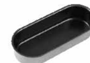
乳酪蛋糕模(800系列不沾) 1.0mm铝合金 SN6866 170x65x37mm