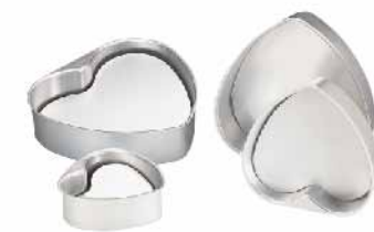
活动心型模(阳极) 1.0mm铝合金 SN6844 6" 142x134x55mm SN6846 8" 189x178x60mm SN6848 10" 236x222x67mm