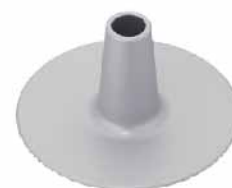
9"圆型布丁心(阳极) 1.0mm铝合金 SN5296 圆径202x104mm