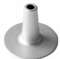
6"戚风蛋糕心-圆型(阳极) 1.0mm铝合金 SN5303 圆径145x105mm