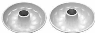
浅双层空心菊花模(阳极) 1.0mm铝合金 SN6820 圆径179x63mm SN6821 圆径179x63mm