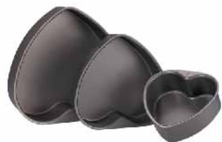
固定心型模(硬膜) 1.0mm铝合金 SN6914 6" 142x134x55mm SN6916 8" 189x178x60mm