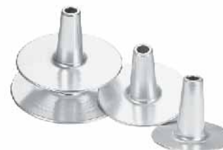
圆型布丁心(阳极) 1.0mm铝合金 SN5293 6" 圆径130x105mm SN5295 8" 圆径181x100mm