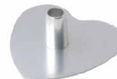
10"心型布丁心(阳极) 1.0mm铝合金 SN5300 235x222x80mm