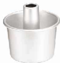
6"活动日式戚风蛋糕模(阳极) 1.0mm铝合金 SN5234 152x130x115mm