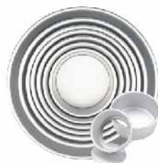
活动布丁模(阳极) 1.0mm铝合金 SN5222 5" 127x113x57mm SN5232 6" 152x135x70mm SN5252 8" 203x183x80mm