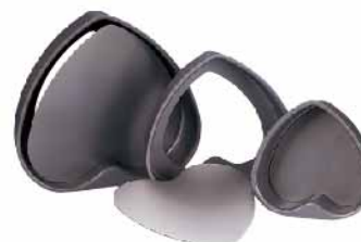
活动心型模(硬膜) 1.0mm铝合金 SN6904 6" 142x134x55mm SN6906 8" 189x178x60mm SN6908 10" 236x222x67mm