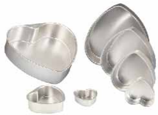
固定心型模(阳极) 1.0mm铝合金 SN6851 3" 73x68x27mm SN6852 4" 93x88x35mm