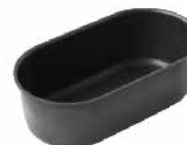
乳酪蛋糕模(1000系列不沾) 1.2mm铝合金 SN6867 140x72x46mm