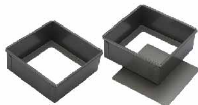
活动方型蛋糕模(硬膜) 1.0mm铝合金 SN5121 8" 145x145x60mm SN5123 10" 180x180x60mm SN5125 12" 215x215x60mm