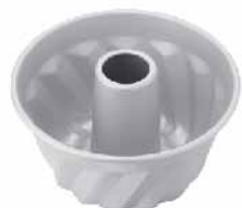
咕咕霍夫模(阳极) 1.0mm铝合金 SN6829 14cm 圆径140x78mm SN6823 18cm 圆径180x95mm SN6824 22cm 圆径220x115mm