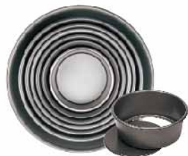
活动布丁模(硬膜) 1.0mm铝合金 SN5221 5" 127x113x57mm SN5231 6" 152x135x70mm SN5251 8" 203x183x80mm