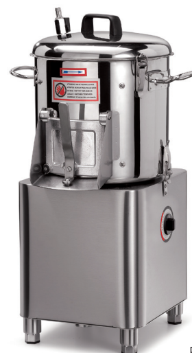
PPJ 6 SC