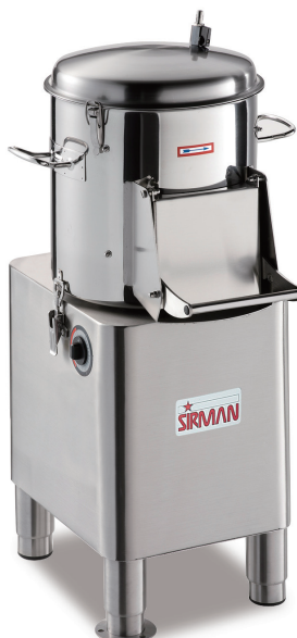
PPJ 10 SC PPJ 20 SC