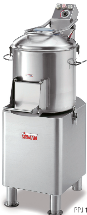
PPJ 10 / 20