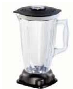
新型圆形容器, 可安装在 BARMASTER Q 上