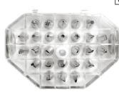
(韩国) 糖花花嘴-26粒 304J1不锈钢+聚乙烯(PE) TS-782 26粒装