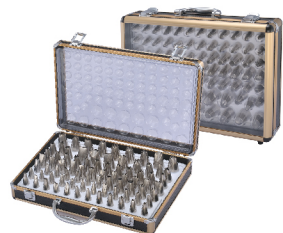
铝合金+PS塑料+0.4mm304不锈钢 SN7011 手工花嘴-80粒装