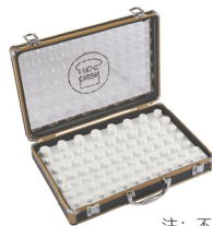
注：不含花嘴 80粒花嘴盒 铝合金+聚苯乙烯(PS) SN7002 395x290x95mm