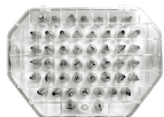
(韩国) 糖花花嘴-52粒 304J1不锈钢+聚乙烯(PE) TS-783 52粒装