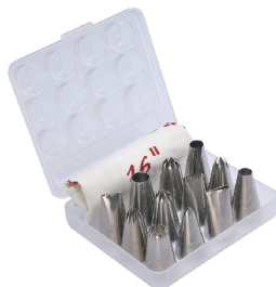
0.4mm304不锈钢 SN7014 花嘴-12粒装