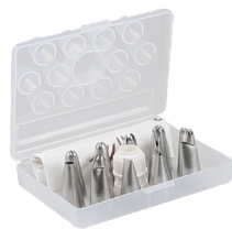
0.4mm304不锈钢 SN7017 小型花嘴-12粒装