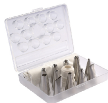
0.4mm304不锈钢 SN7015 小型花嘴-12粒装