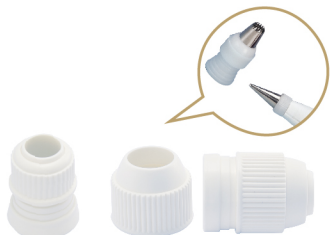
花嘴换模器 聚丙烯(PP) SN77914 小(2入) 23x35mm SN7792 大 3件组