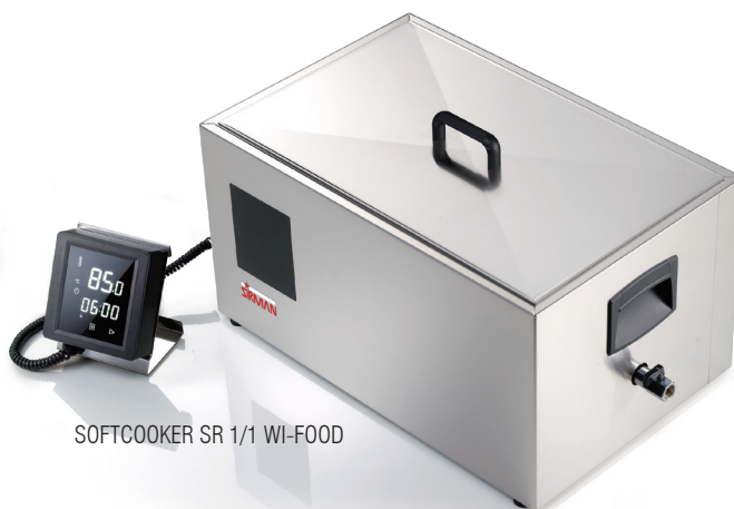
SOFTCOOKER SR 1/1 WI-FOOD