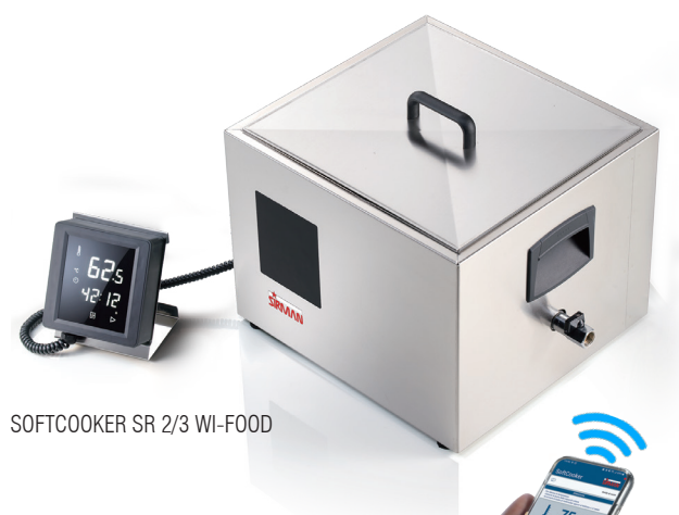
SOFTCOOKER SR 2/3 WI-FOOD