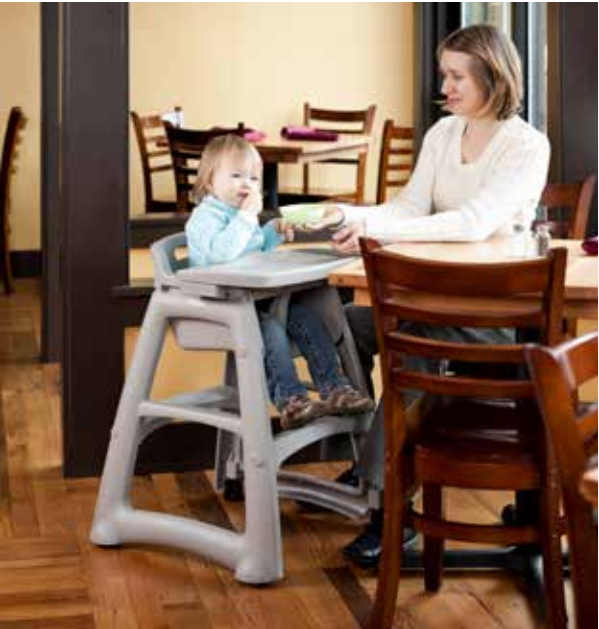
**2006年款乐柏美儿童座椅