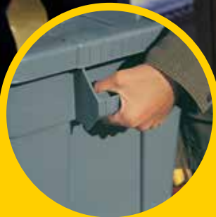
人体工程学设计，运输方便