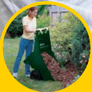
适用于繁重，长时间的使用