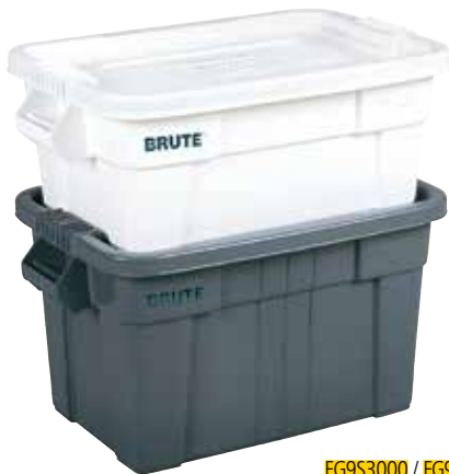
FG9S3000 / FG9S3100