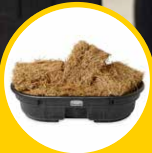
异常坚固的构造，性能卓越