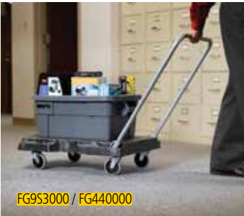
FG9S3000 / FG440000