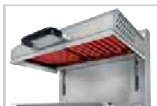
Résistances blindées / Metal heating elements