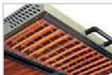
Quartz infrarouges / Infrared quartz tubes (1050°C)

Common points : 2 independent cooking areas, removable inside tray. Working height: mini = 90 mm/maxi = 245mm. Wall-mounting set upon request. (SM1 for 600 mm salamanders)