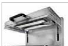
Gaz forte puissance / High power gas