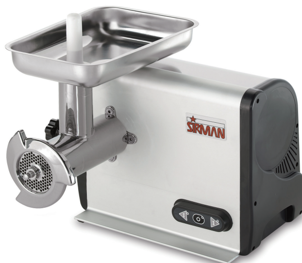
TC 22 DAKOTA

中小机型 强力风冷马达，IP55保护级齿轮箱，无需工具即可拆卸所有部件，方便清洁；