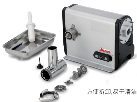
方便拆卸,易于清洁