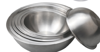
打蛋盆-丝纹 0.6mm304不锈钢 SN4961 36cm 360x145mm SN4962 33cm 330x135mm SN4963 30cm 300x120mm SN4964 28cm 280x110mm SN4965 26cm 260x108mm SN4966 24cm 240x105mm SN4967 22cm 220x90mm SN4968 20cm 200x80mm