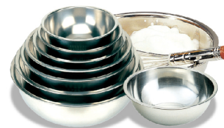
打蛋盆 0.6mm304不锈钢 SN4951 36cm 360x145mm SN4952 33cm 330x135mm SN4953 30cm 300x120mm SN4954 28cm 280x110mm SN4955 26cm 260x108mm SN4956 24cm 240x105mm SN4957 22cm 220x90mm SN4958 20cm 200x80mm

优质进口食品级不锈钢材料制成； 双面经过镜面抛光处理，美观耐用； 专业的圆弧底座型设计，使用得心应手。