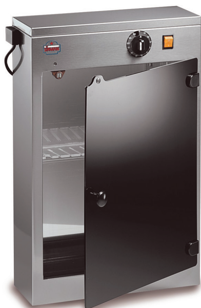
STER UV 16W