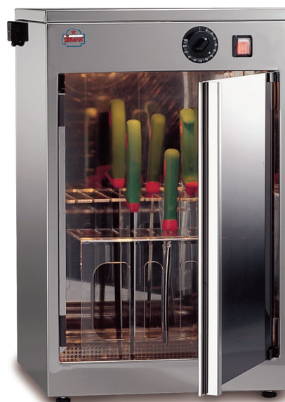
STER UV 24W

型号多样 16W 型号能放15把刀, 24W能放20把刀。带120 分钟的定时器, 开门处带安全开关, 烟熏玻璃门;